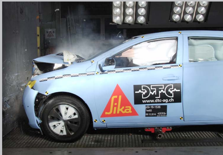
SIKA LASILIIMAUSMENETELMÄ TAKAA TURVALLISEN MATKAN.

SikaTack®-DRIVE:lla voidaan liimata käyttäen molempia Sikan menetelmiä. Sika Aktivator PRO -menetelmä mahdollistaa helpon ja luotettavan liimausmenetelmän tavanomaiselle lasinvaihdolle. Sika Primer-207 -menetelmällä varastointikulut pysyvät pienempänä käytettäessä ainoastaan yhtä tuotetta kaikissa työvaiheissa (kts. taulukko alla).